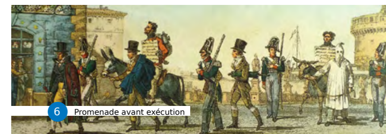
6 Promenade avant exécution

Elle était installée tout simplement sur Piazza del Popolo ce qui permettait à tout arrivant de comprendre qu'à Rome on ne rigolait pas avec la délinquance. Deux jeunes carbonari, entre autre, en firent les frais. Une plaque (Photo n°4) située en face de la façade de l'église Santa Maria del Popolo le rappelle et indique que le 23 Novembre 1825 ils furent condamnés pour assassinat « sans preuve et sans défense » et exécutés. Et que dire de la scène magistrale du film Il Marchese del Grillo où le Marchese giffle la jeune Olympe à la suite de la décollation de Don Bastiano, comme tous bons parents envers leurs enfants pour bien leur montrer quelle est la fin des brigands. Tradition romaine très ancienne et