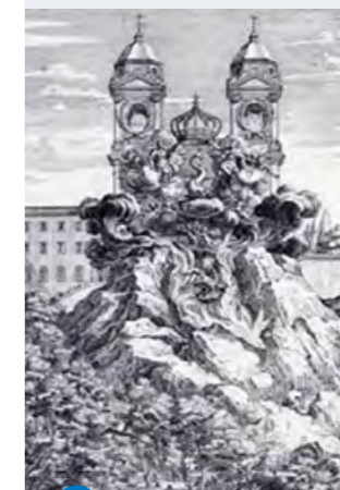
7 Décor de fête à la Trinité des Monts en 1662

En 1662, à l'occasion de la naissance du dauphin de France, le Cardinal Barberini organisa des fêtes grandioses à Rome. À cette occasion, l'église de la Trinité des Monts et la pente de la colline boisée y menait furent décorées d'une manière somptueuse. (Photo n°7). La décoration nécessita trois mois de travail.