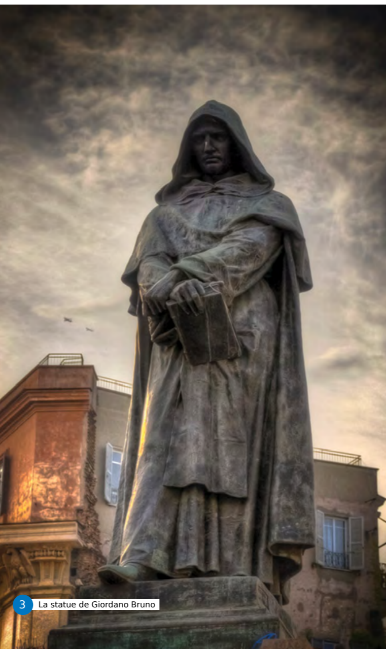
3 La statue de Giordano Bruno

Mais ceci n'était que calembredaine pour un délit commun on avait droit à « la Mazzola » ou encore mieux à la pendoison. Le gibet « la Forza » se trouvait