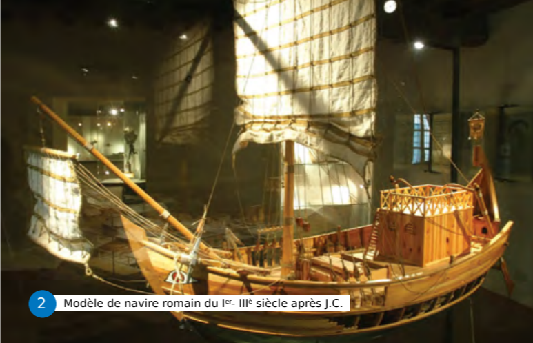
2 Modèle de navire romain du I er - III e siècle après J.C.

Comment, avec les techniques de l'époque, pouvait-on réussir cet approvisionnement, dont la régularité demeura relativement constante pendant