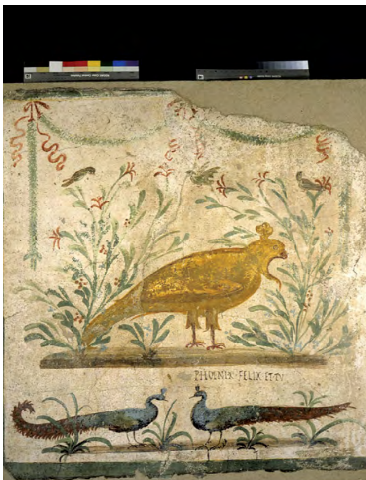
5 Enseigne de la Fenice (Pompei)