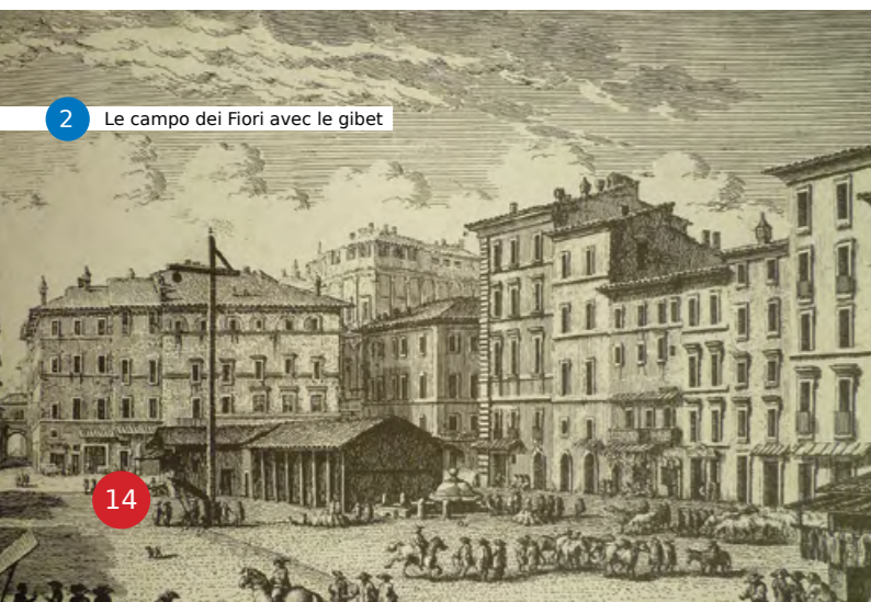
2 Le campo dei Fiori avec le gibet

Pour les petits délits, le coupable pouvait écopier de coups de fouet en public. Si une prostituée ou un religieux était surpris déguisé durant le Carnaval, ils avaient droit au Cavaletto (Photo n°1). C'était