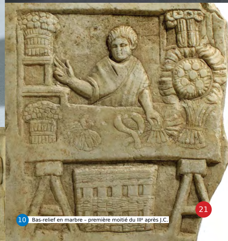
10 Bas-relief en marbre - première moitié du III e après J.C.