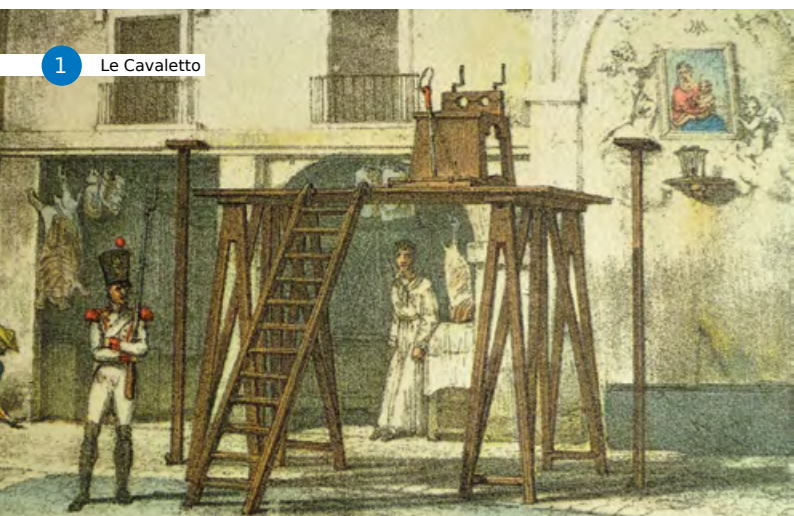
1 Le Cavaletto