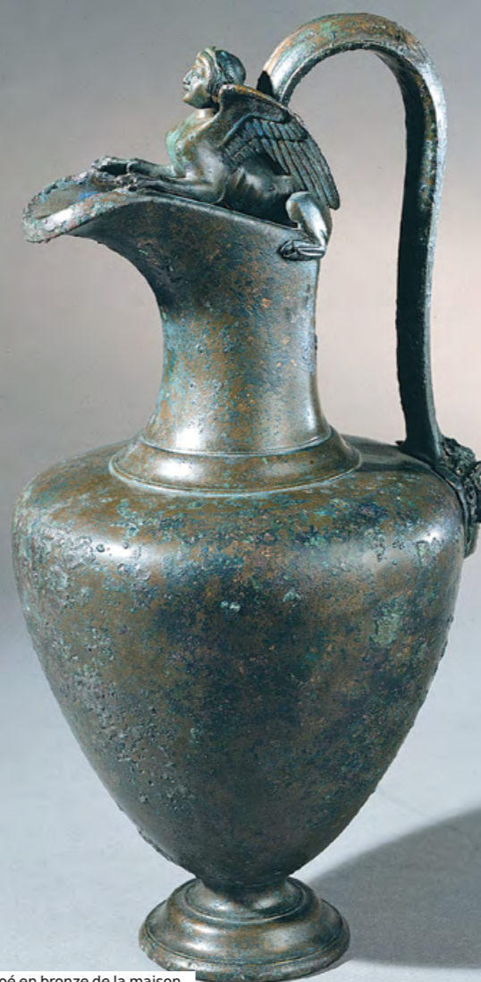
8 Énochoé en bronze de la maison de Giulio Polibio (Pompei)