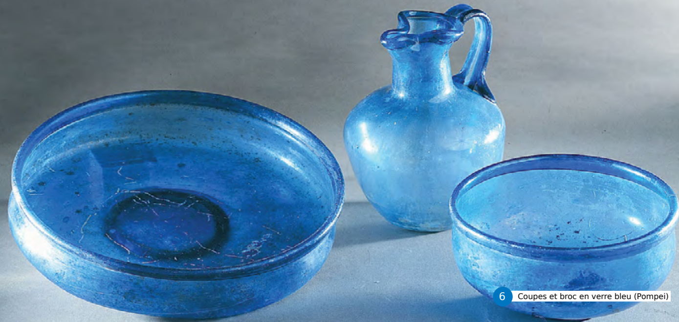
6 Coupes et broc en verre bleu (Pompei)