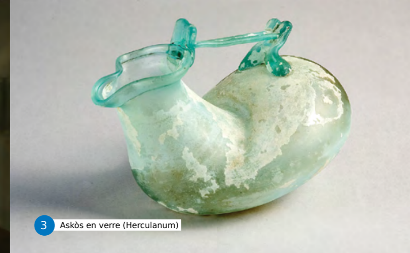
3 Askos en verre (Herculaneum)

quatre siècles, en dépit de tous les soubresauts politiques que connut le régime impérial ? C'est là que l'exposition devient particulièrement instructive.