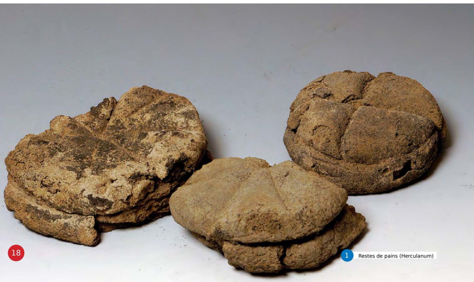
1 Restes de pains (Herculaneum)

L'huile arrivait en général à Rome après un traitement sur place mais ce n'était pas le cas pour