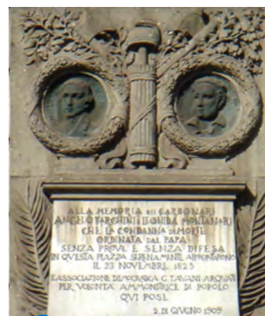
4 Plaque souvenir Piazza del Popolo