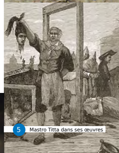
5 Mastro Titta dans ses œuvres

en permanence sur le Campo dei Fiori (Photo n°2) et à l'entrée du Ghetto. Si, par contre, l'on était accusé de sorcellerie, pas de pitié la sentence était la mort par le feu. C'était en majorité les femmes qui étaient brûlées vives. Elles s'appelaient Faustina, Domitilla ou Cecilia, mais ne passèrent pas à la postérité. Seul est resté dans les mémoires un homme, Giordano Bruno, brûlé le 17 Février 1600 comme hérétique sur le Campo dei Fiori. Sa statue, érigée en 1889, en rappelle le triste destin (Photo n°3). Devant la statue, chaque année le 17 Février y sont déposées des gerbes de fleurs.