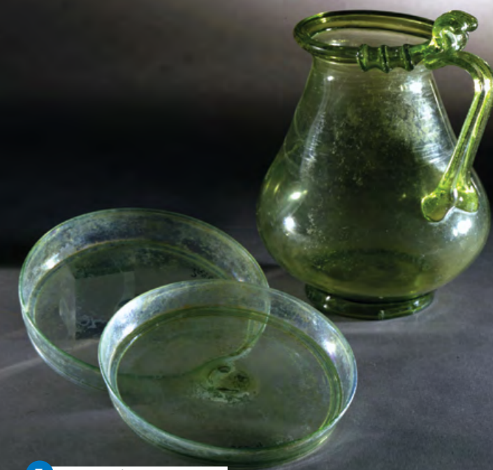
7 Coupes et broc en verre vert (Pompei)