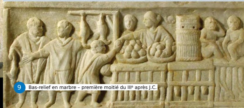
9 Bas-relief en marbre - première moitié du III e après J.C.