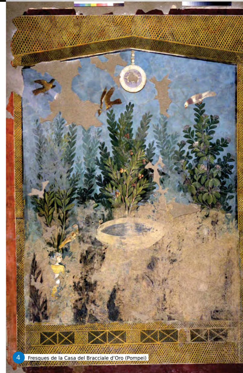
4 Fresques de la Casa del Bracciale d'Oro (Pompeii)

Les navires terminaient leur voyage dans des ports proches de Rome. Là, l'exposition nous raconte la belle histoire de ces ports, celle des ports maritimes d'Ostie et de la côte au nord et au sud de Rome, mais elle nous conte aussi l'histoire des ports urbains sur le Tibre, qui se déplacèrent plusieurs fois au cours des siècles. Des cartes illustrent particulièrement bien cette histoire. Les produits débarqués, il fallait alors les stocker puis les mettre à la vente. Les horrea constituaient l'infrastructure essentielle de ce stockage. On en retrouve de bonnes traces à Ostie mais aussi dans de très nombreux autres sites. L'exposition s'interroge sur ces marchands et ces administrateurs qui en assuraient la gestion. L'étude des marchés nous donne d'autres clés de lecture,